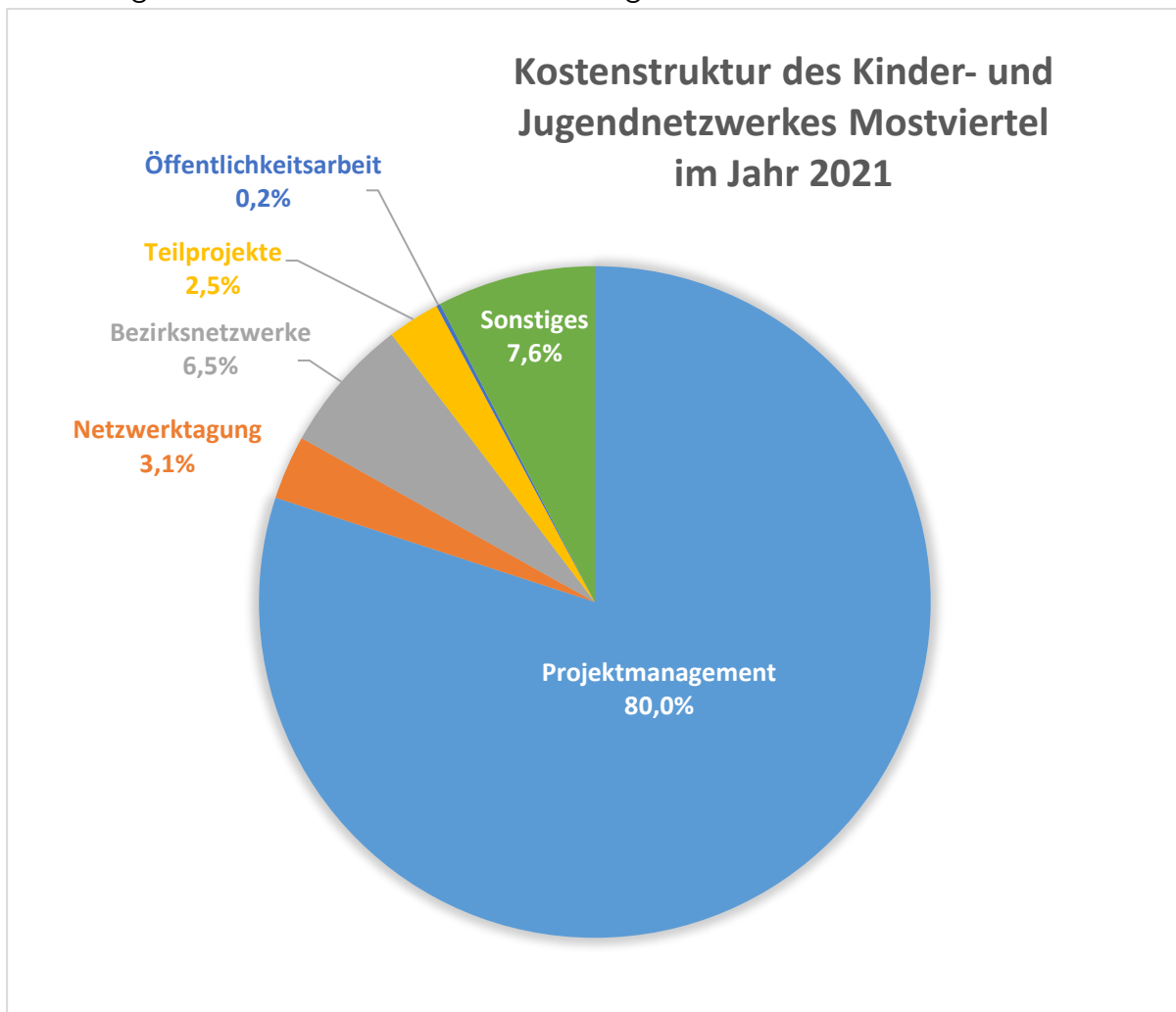
Abbildung 3: Kostenstruktur des Kinder- und Jugendnetzwerkes Mostviertel im Jahr 2021

Eine detailliertere Aufschlüsselung des Ausgabenbereiches Projektmanagement bietet Abbildung 4.